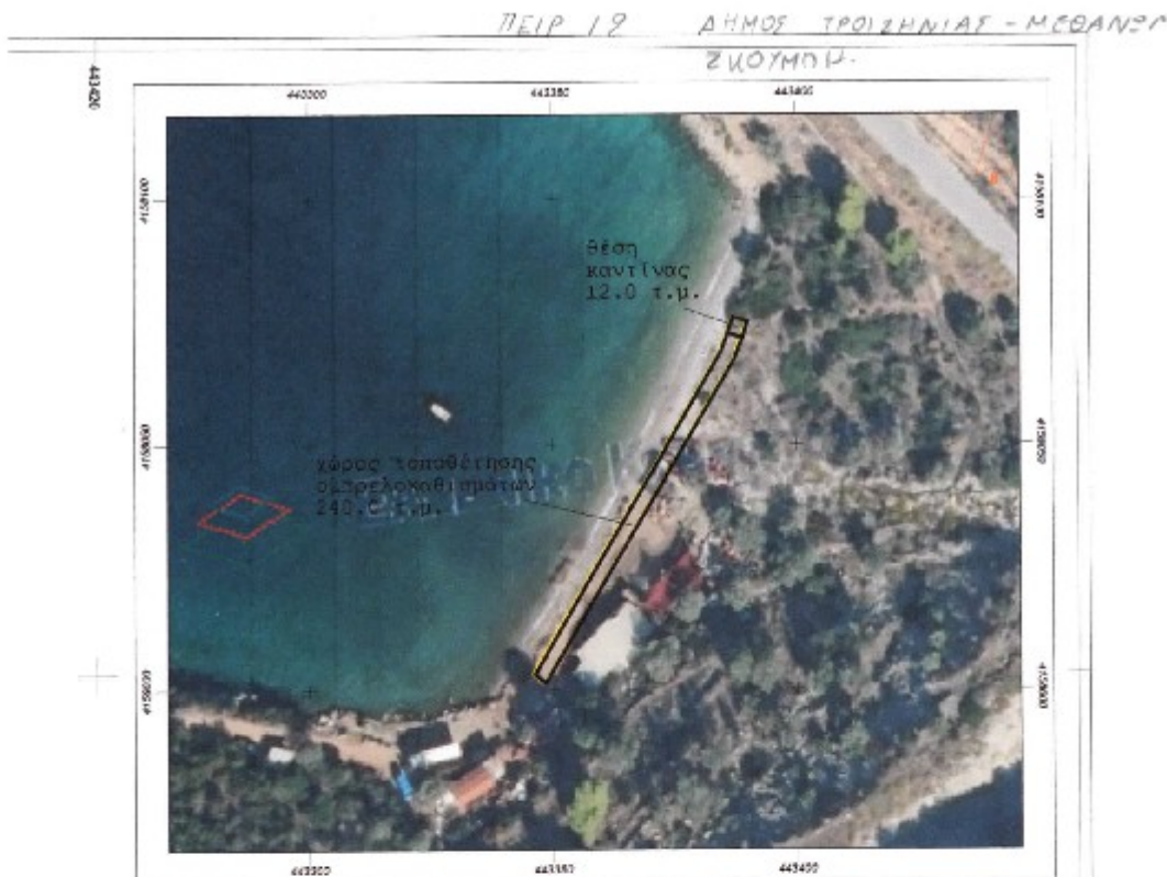
Απόσπασμα ορθοφωτοχάρτη ΕΚΧΑ

Η εξάρτηση από το Ε.Γ.Σ.Α. 87 έγινε με δέκτη GNSS (GRS1-N) της TOPCON με παρατηρήσεις που διεξήχθησαν την 31/3/2019 κάνοντας χρήση του σταθμού αναφοράς Αίγινας του ιδιωτικού Δικτύου URANUS με συντεταγμένες (X,Y)=(450494.684,417611.277) με τη μέθοδο της Κινηματικής Μέτρησης Πραγματικού Χρόνου (RTK).